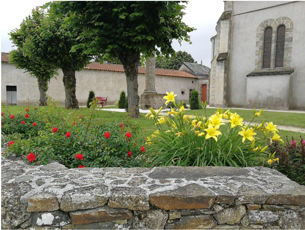
Annexe 1 : Place de l'église (site 309), code 1