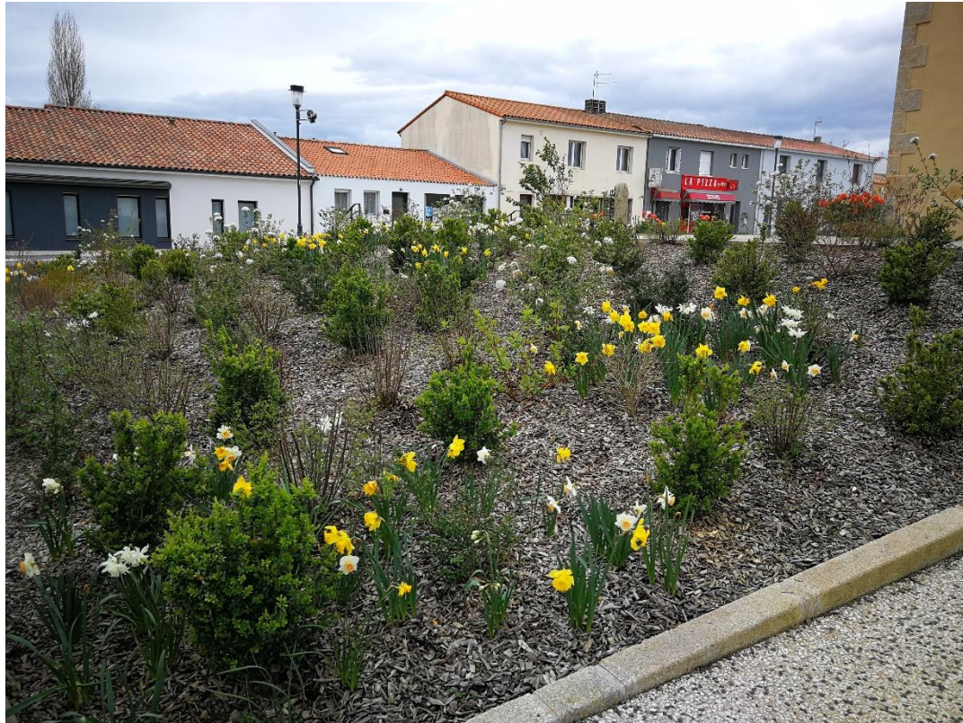
Annexe 3 : Espace René Giraudet (site 435), code 1 (C. CHEVRIER)