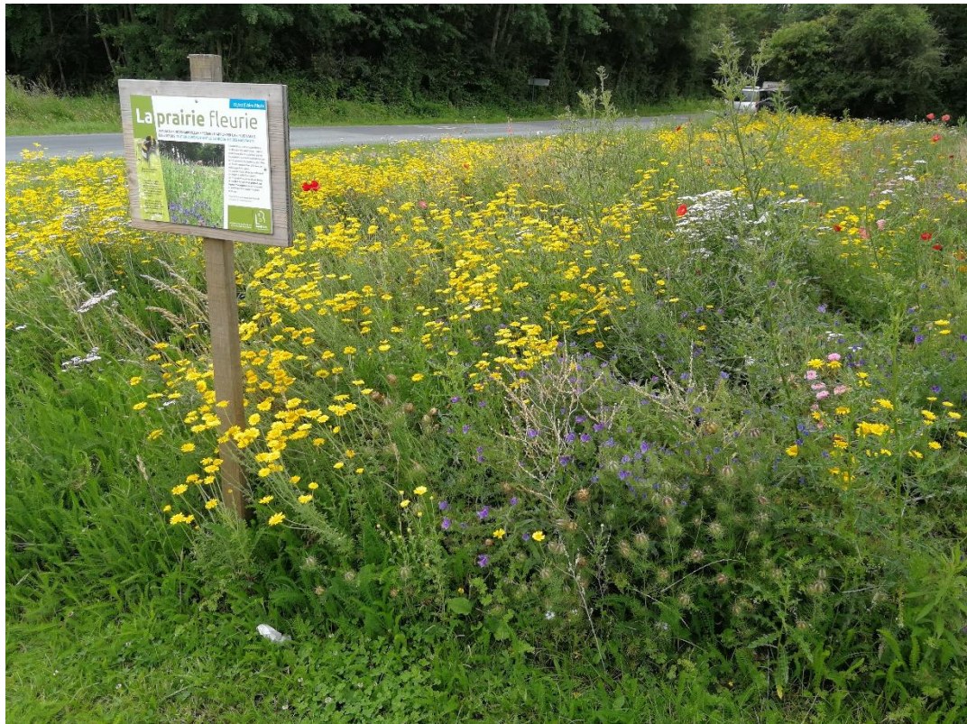
Annexe 11 : Prairie fleurie, EHPAD Le Clos des Grenouillers (site 316), code 4 (C. CHEVRIER)