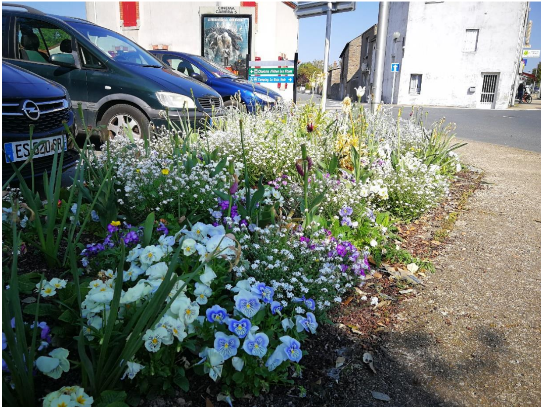
Annexe 5 : Rue de la Vendée (site 430), code 2 (C. CHEVRIER)