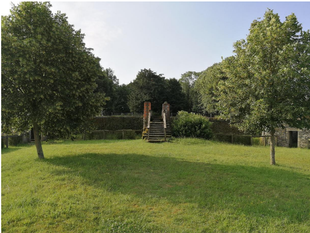
Annexe 6 : Château de la Sénardière (site 396), code 2 (C. CHEVRIER)