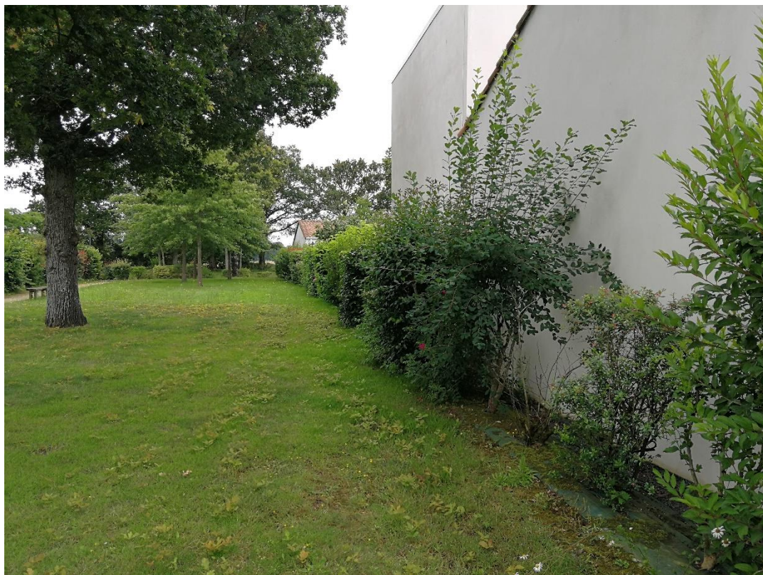
Annexe 4 : Rue des Mésanges (site 341), code 2 (C. CHEVRIER)