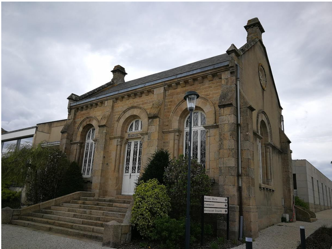
Annexe 2 : Mairie (site 434), code 1 (C. CHEVRIER)