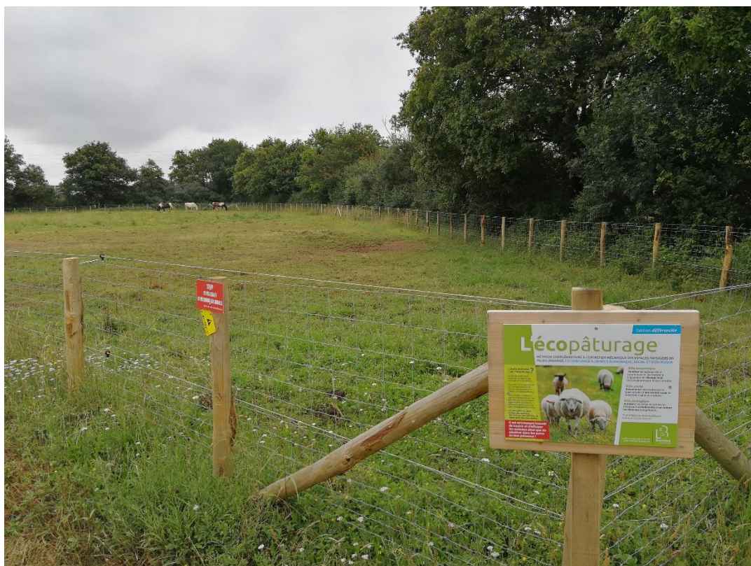
Annexe 12 : Ecopâturage du Bois Joli (site 347), code 4