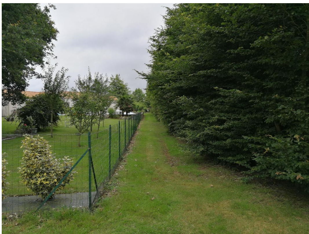
Annexe 8 : Bande enherbée de propreté, Espace vert du Tamaris (site 373), code 3 (C. CHEVRIER)