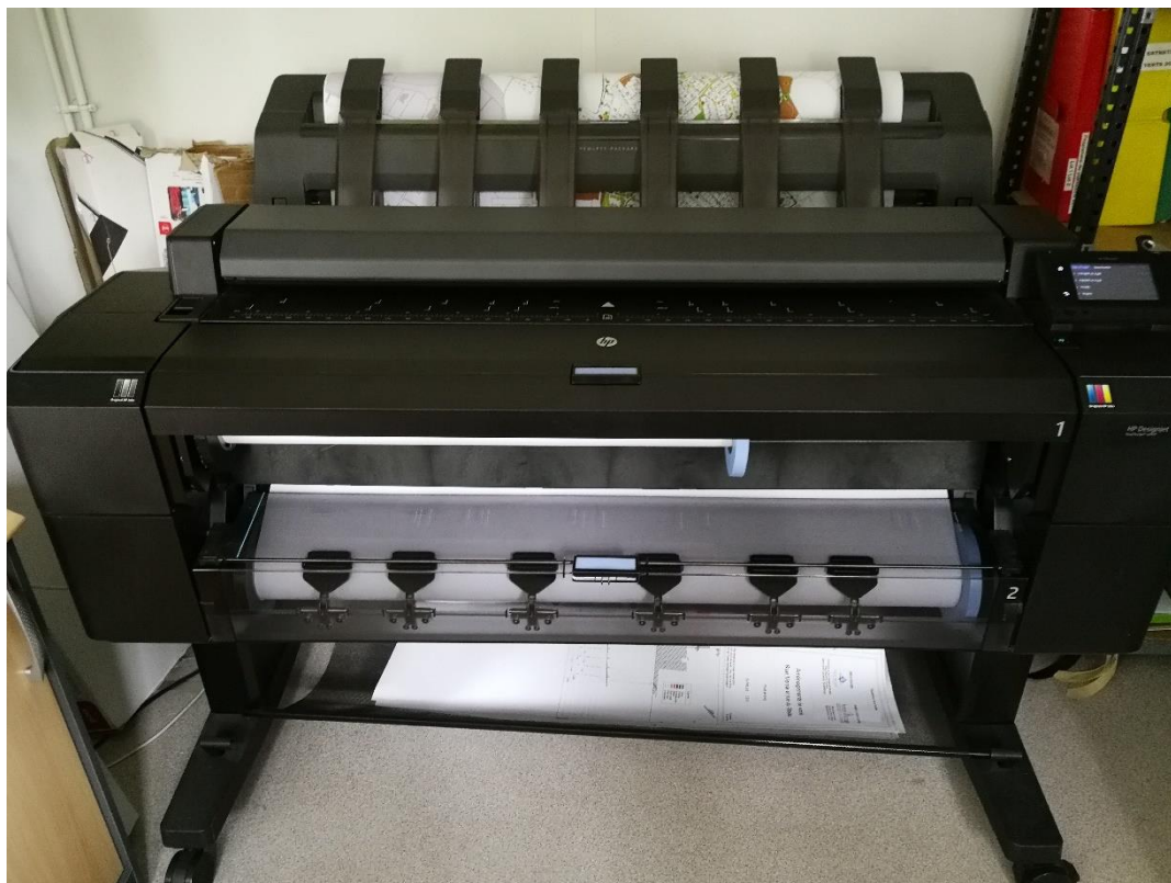
Annexe 13 : Traceur de Terres de Montaigu (C. CHEVRIER)