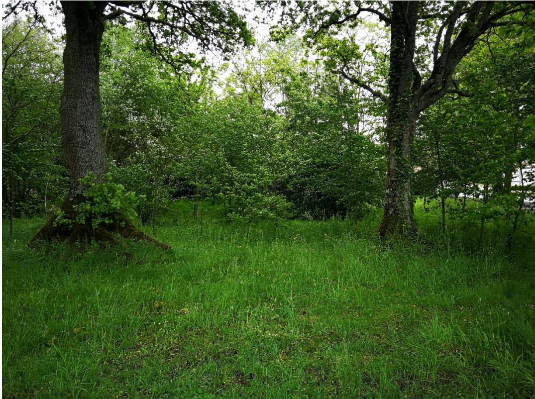
Annexe 9 : La Vergnaie (site 404), code 4 (C. CHEVRIER)