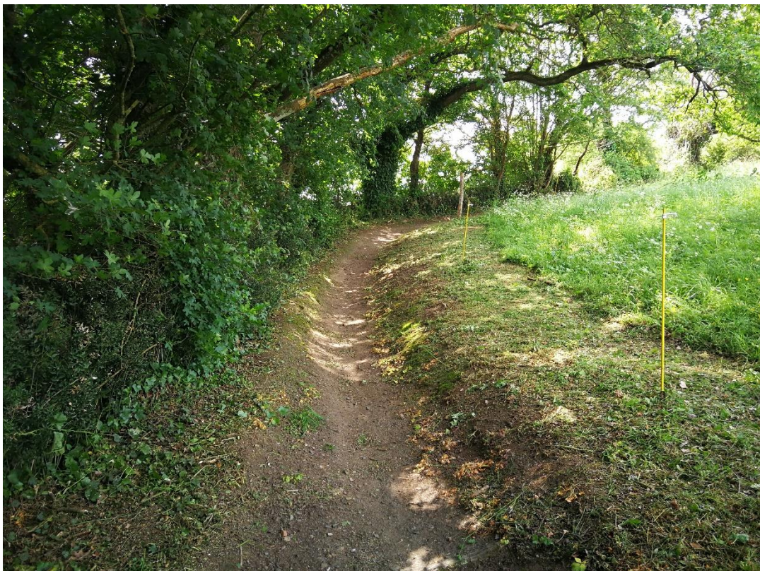
Annexe 10 : Chemin de l'Orvoire (site 395), code 4 (C. CHEVRIER)