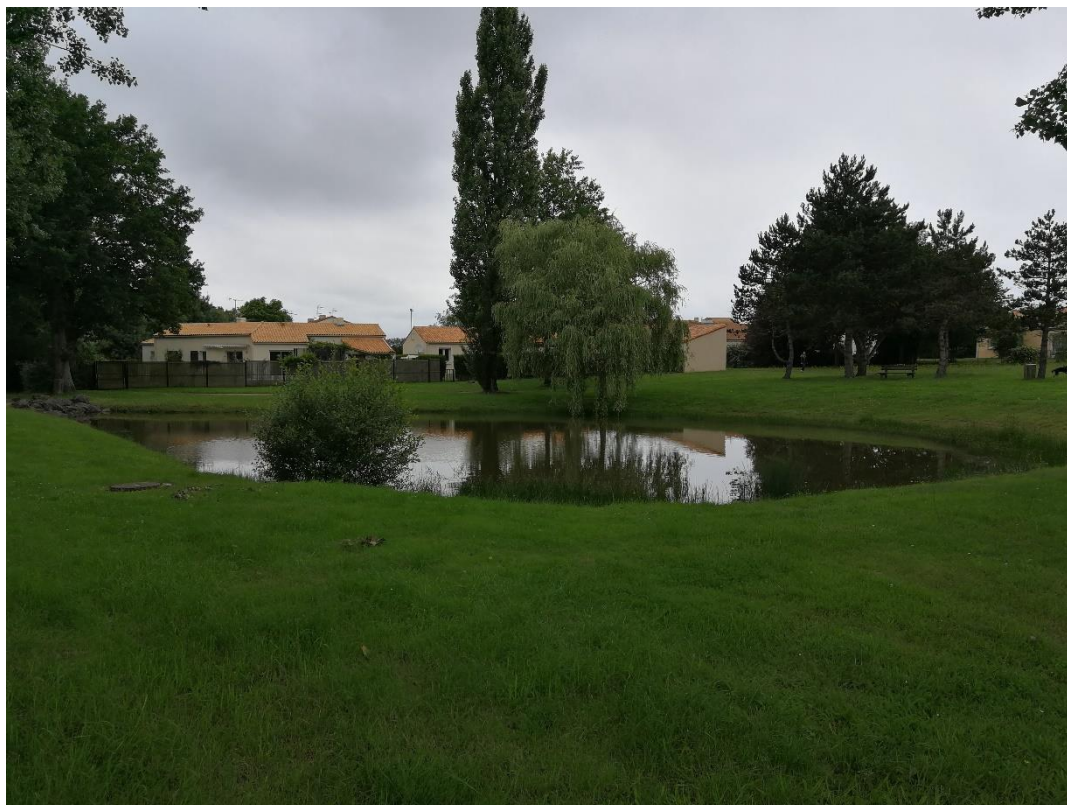
Annexe 7 : Espace vert de la Rue des deux mares (site 353), code 3 (C. CHEVRIER)